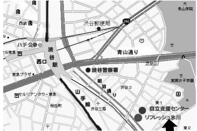
渋谷区リフレッシュ氷川