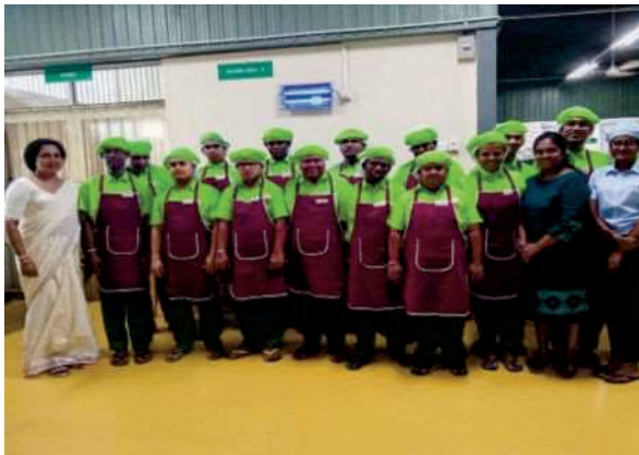
【スリランカ サハンセバナのメンバー】