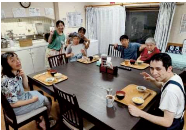
えびす・ぱれっとホーム 料理教室