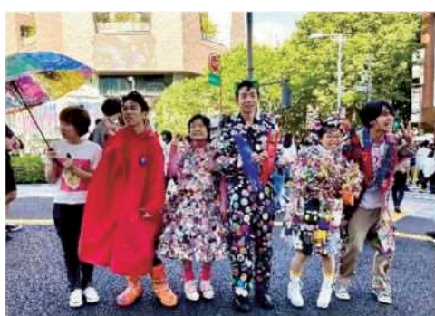
▲シブヤフォントインクルーブファッションショー ～ショウガイはへんしんできる～