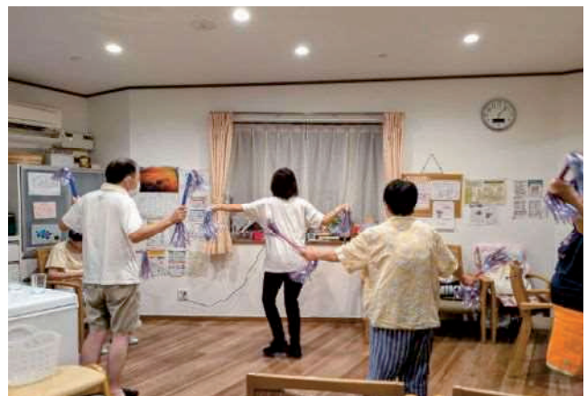
しづや・ぱれっとホーム ダンス教室