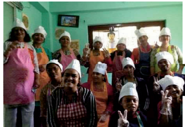
【ネパールPCBRのメンバー】